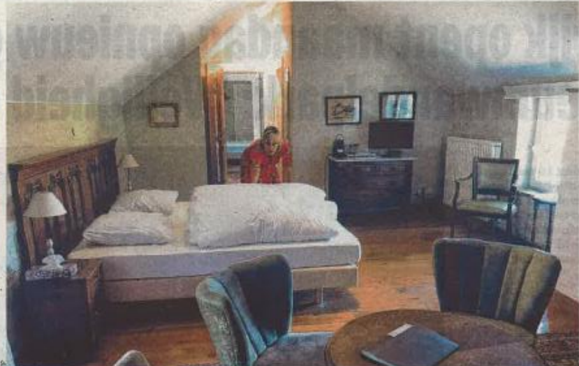
Rudi Pascal en Marina Vergauwen hebben in januari B&B Kasteelhoeve De Tornaco in Borgloon overgenomen. "We gingen op 21 maart officieel open, maar door corona is dat in het water gevallen. Om deze crisis te overbruggen komt de zuurstoffinanciering als geroepen", zegt Rudi.

Met de 'zuurstoffinanciering' lanceert gedeputeerde Igor Philtjens (Open VLD) een strategisch instrument om de liquiditeitspositie van de logiessector te versterken. "Volgende maand krijgen de Limburgse logies een kapitaalinjectie van 2 miljoen euro. Met dit budget worden 40.000 bedden - nagenoeg de volledige Limburgse over-