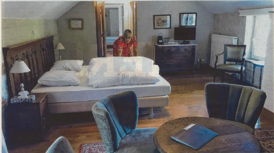
Rudi Pascal en Marina Vergauwen hebben in januari B&B Kasteelhoeve De Tornaco in Borgloon overgenomen. 'We zouden op 21 maart officieel opengaan, maar door corona is dat in het water gevallen. Om deze crisis te overbruggen komt de zuurstoffinanciering als geroepen', zegt Pascal.

Limburg lanceert all-in toeristisch relanceplan