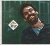
Waarom... Hoe... Wat... Waarom... Hoe... Wat...