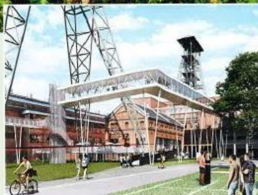
Het belevingsproject van Be-Mine.

'Fietsen door de Bomen' is het nieuwste paradepaardje. Fietsers rijden een afstand van 700 meter over een fietsbrug in de vorm van een dubbele cirkel, met een doorsnede van 100 meter. De brug