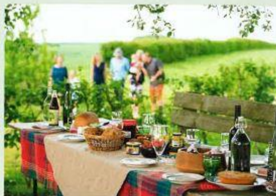
Een picknick met lokale streekproducten in Haspengouw.

Ook op twee oude spoortracés komen er nieuwe belevingsroutes. Het 60 kilometer lange Kolenspoor verbindt de zeven vroegere mijnzetels, van Beringen tot Maasmechelen. Die mijnzetels hebben allemaal een tweede leven gekregen als culturele en toeristische locaties, door renovatie en herbestemming. "Het Kolenspoor wordt een topbelevingstraject met erfgoed en natuur in de hoofdrol", zegt Igor Philtjens. "Het Fruitspoor zal een fietslus worden doorheen de Haspengouwse fruitstreek. Haspengouw is met name feestelijk tijdens de bloesemperiode, maar ook in de andere seizoenen is het er heerlijk fietsen, omwille van het fruit, het erfgoed, de gastronomie en de groeiende wijncultuur."