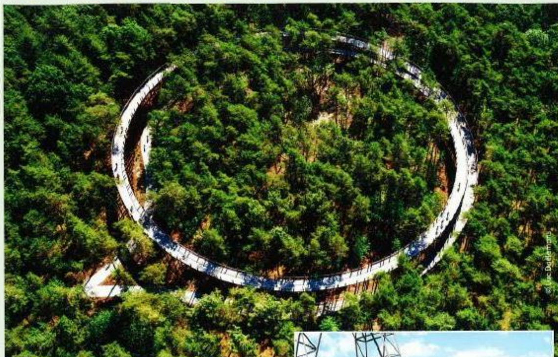
Bovenaanzicht van 'Fietsen door de Bomen'.