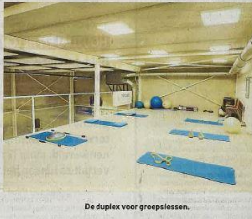
De duplex voor groepslessen.