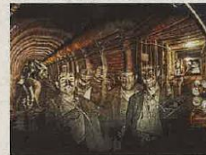
De ondergrondssimulatie laat de bezoekers voelen hoe zwaar het werk in de ondergrond was.

De vijf groepen worden nu uitgenodigd om tegen januari 2020 een eerste indicatieve offerte met visie-nota en voorontwerp in te dienen. Vervolgens worden de beste voorstellen uitgewerkt en voorgelegd aan de vakjury. De definitieve beslissing wordt verwacht in juni 2020. Pas daarna kunnen de werken starten. Eind 2022 is de opening gepland van Be-Mine PIT.