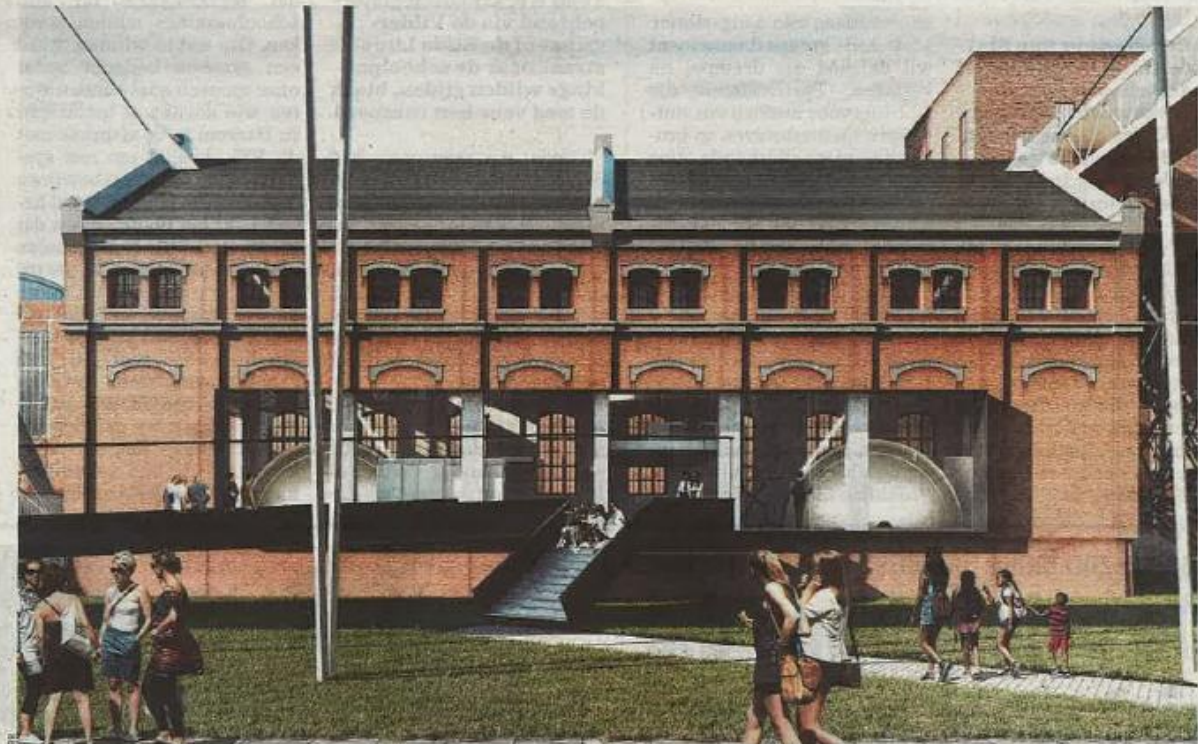
■ Het mijnwerkspad start in een nieuw bezoekerscentrum in het ophaalgebouw.