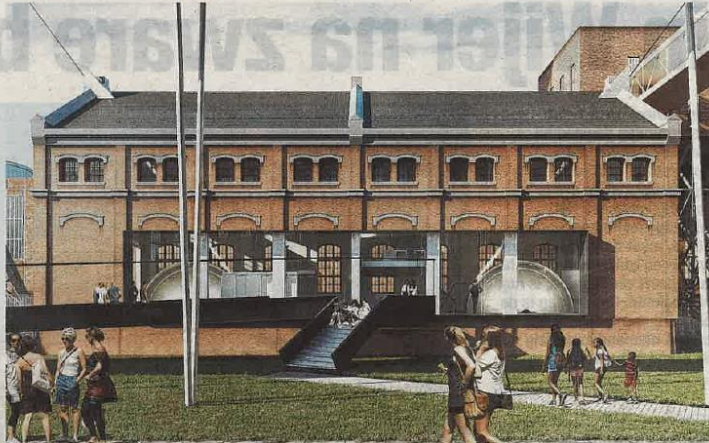
Het mijnwerkerspad start in een nieuw bezoekerscentrum in het ophaalgebouw.