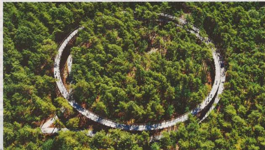
■ Het gloednieuwe 'Fietsen door de Bomen' lokte de voorbije maand 61.000 fietsers.

De forse terugval van het aantal vakantiegangers in vergelijking met juli 2018, toen Limburg volgens de schatting van de provincie nog 178.000 gasten mocht verwelkomen, moet volgens Philtjens ook worden genuanceerd. "Onze cijfers zijn schattingen op basis van een uitgebreide rondvraag van Toerisme Limburg. Die 150.000 vakantiegangers van dit jaar liggen in lijn met de officiële cijfers van de FOD Economie over juli 2018 (157.000