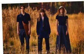
Een groep uit de collectie van Tim Van Steenberghe die de medewerkers van Bokrijk zullen dragen (uitgezonderd de mutsen).