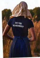
hair/make-up Palma Pretti locatie Kasteel van Bokrijk (valdeb.be)

"Hier thuis, (kijkt in het rond), waar ik allerlei mooie dingen verzamel. Van meubels tot vlinders tot boeken, foto's van alles eigenlijk. Ik wil me niet