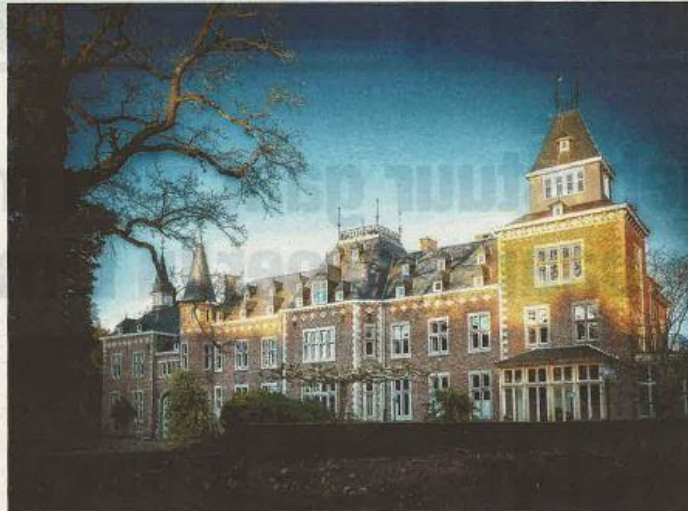
In het kasteel krijgen ambachtsmensen hulp om ondernemer te worden.

vanuit het hart. Er gaat steeds meer vraag naar komen. Maar ouders blijven hun kinderen nog te makkelijk richting Latijn duwen. Daarin zien wij de maatschappelijke rol van Bokrijk: tonen hoe belangrijk, hip en trendy vakmanschap is. Elk jaar krijgen we een miljoen bezoekers over de vloer. Jongeren moeten hier in het kasteel buiten gaan en zeggen: Mama, papa, dat wil ik leren. "