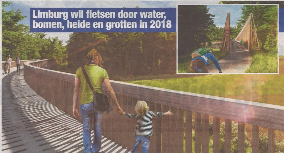
Het nieuwe fietspad, opgetrokken uit voornamelijk hout, zal een prachtig uitzicht over de Mechelse Heide bieden.

Limburg wil fietsen door water, bomen, heide en grotten in 2018