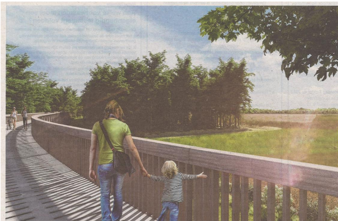
Op de brug over de heide zullen ook wandelaars toegelaten worden.

Limburg wil fietsen door water, bomen, heide en grotten in 2018