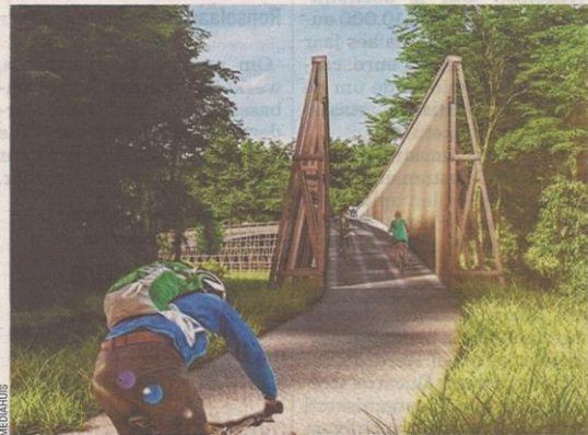
■ De aanloopstrook naar de sbrug.

"We gaan de wegberm dan ook versmallen, waardoor chauffeurs wel moeten afremmen. Dat gebeurt samen met de aanleg van de fietsbrug, we nemen ook hun huisstijl over om fietsers overal dezelfde look and feel te geven. Het bud-