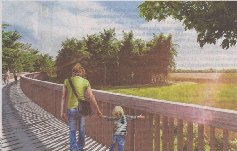
■ Het nieuwe fietspad zal een prachtig uitzicht over de Mechelse Heide bieden.

"Fietsen door het water was de eerste stap, voor fietsen door de bomen in Hechtel-Eksel zitten we in de laatste rechte lijn voor de bouwvergunning. Er zijn geen bezwaren ingediend tijdens het openbaar onderzoek. Tegen eind 2018 willen we zowel fietsen door de heide in Maasmechelen, fietsen onder de grond in de Riemstse mergelgrotten en fietsen door de bomen in