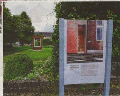
Een studiemodel van de nieuwe muur kan je vandaag al gaan ontdekken in de begijnhofmuur.

Het gebouw is zo opgevat dat er meerdere tentoonstellingen gelijktijdig kunnen lopen en dat ook externen ervan gebruik kunnen maken. "Het gelijkvloers wordt één ruime publieke zone, waar iedereen kan genieten van de architectuur en de begijnhofmuur, zonder de tentoonstellingen te moeten bezoeken."