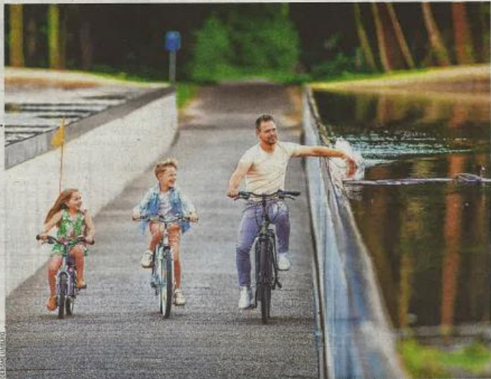
• "Sinds de opening van het pad in april 2016 passeerden hier al meer dan 200.000 fietsers uit binnen- en buitenland"

"Het biedt ons de kans om over de grenzen te kijken. Eroica werd in 1997 opgericht als een stichting om de gravelwegen van Toscane te beschermen. Die gedachte resulteerde in de organisatie van een wielerevenement, dat uitgroeide tot een wereldwijd succes. Vorig jaar vond in de regio rond Valkenburg de eerste Nederlandse editie plaats. Dat beide Limburgen nu samen instaan voor de organisatie, maakte deel uit van een toeristisch vijfjarenplan om