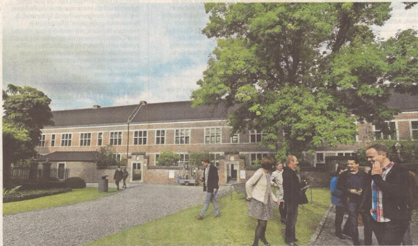
Een beeld van een rondleiding toen het begijnhof te koop werd gezet.

Het was de voorbije maanden de vraag van minstens anderhalf miljoen euro in Hasselt: wie zou het aandurven om na alle kreten van verantwoordiging rond de gedeeltelijke verkoop van het begijnhof een bod uit te brengen? Projectontwikkelaars, die nochtans aanwezig waren op een infodag, wilden zich er uiteindelijk toch niet aan wagen waardoor de UHasselt als enige met een concreet bod op de propgen kwam. Iedereen blij, want er was dan toch een koper en meteen eenje waar alle tegenstanders zich ook achter konden scharen. Een commissie van experts - waaronder voormalig Vlaams bouwmeester bOb Van Reeth - moest zich daarna over het dossier van de unief buigen.