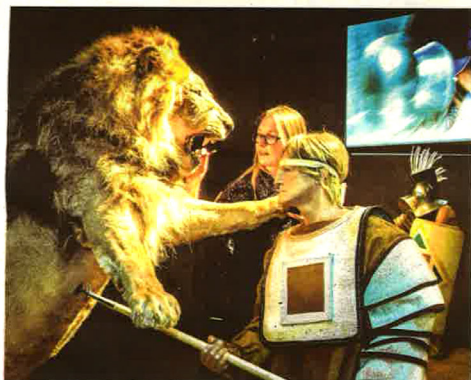
Zo begon een dag in het Colosseum: de moedige jager en het grote beest.

Nooit eerder zijn zoveel topstukken over de gladiatorencultuur samen te zien. Anders moet u 46 Europese musea bereizen, nu kan u gewoon naar Tongeren