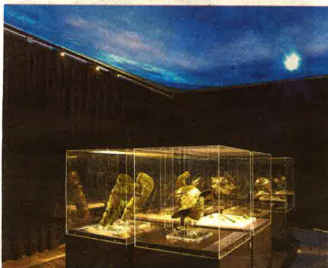
Indrukwekkende helmen onder de ashemel van Pompeii.

tekst op de urne van de Tongerse gladiator Marcus Ulpilus Felix