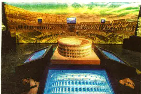
Het Colosseum geeft multimediaal al zijn geheimen prijs.