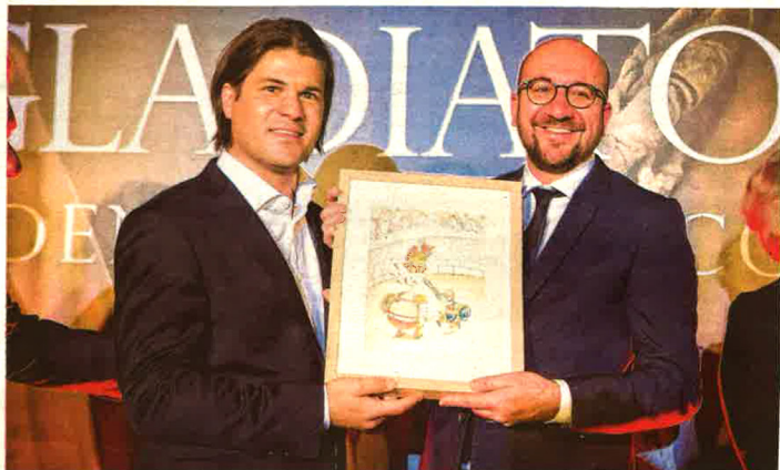
Premier Charles Michel en gedeputeerde van Toerisme Igor Philijns openen de tentoonstelling gisteravond.