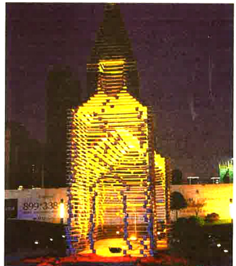
Links: het authentieke doorkijkkerkje in Borgloon. Rechts de kopie in China

zijn dus aan de slag gegaan zonder onze plannen en tekeningen. Waarschijnlijk hebben ze zich gebaseerd op foto's die op het internet circuleren. Nu, liever een slechte replica dan een perfecte kopie, wat we nóg erger hadden gevonden. Ik denk dat mensen nu zelf wel kunnen vaststellen wat echt is en wat namaak.'