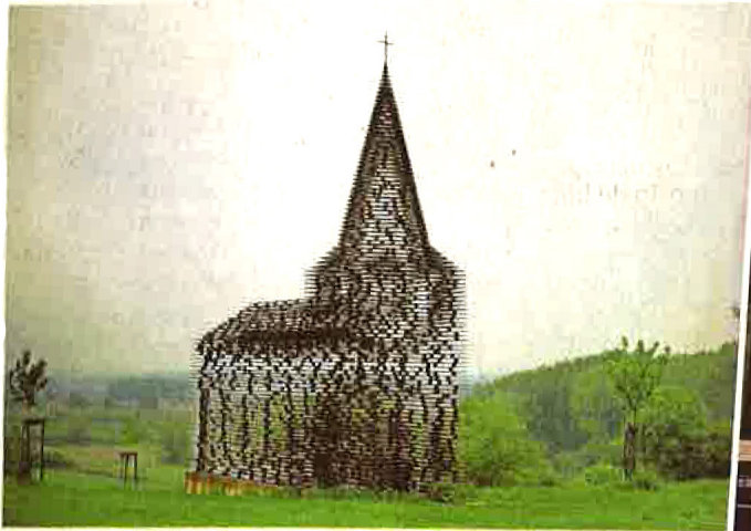
De doorkijkerkerk in Borgloon.

Foto inzet: de doorkijkerkerk in het Chinese Changsha.