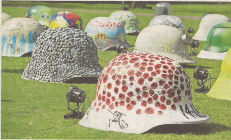
Elke Limburgse gemeente mocht een helm bewerken, met een kleurrijk resultaat.

Achter het kasteel van Bokrijk staan nog tot zondag 7 juni 44 bewerkte Duitse Stahlhelmen. Ze zijn van beton, wegen elk twee ton en maken deel uit van de herdenking 100 jaar Grote Oorlog, die vorig jaar startte. Elke Limburgse gemeente kreeg een identieke kleurloze helm bezorgd. Kunstenaars, socio-culturele verenigingen, scholen