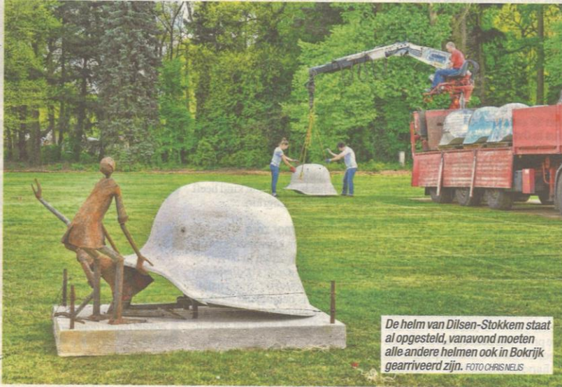
De helm van Dilsen-Stokkem staat al opgesteld, vanavond moeten alle andere helmen ook in Bokrijk gearriveerd zijn.

De betonnen helmen van de Eerste Wereldoorlog verhuizen deze week van alle Limburgse gemeenten naar het domein van Bokrijk in Genk. Twee Limburgse transportfirma's zijn maandag gestart met het ophalen van de eerste vracht helmen. In Bokrijk krijgen de helmen een plaats aan de hoofdingang van het domein, later verhuizen ze naar Halen.