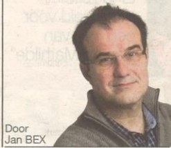
Door Jan BEX

Een stukje uit de nieuwe kaart van het fietsroutenetwerk: 119 extra fietskilometers en 68 bijkomende knooppunten.