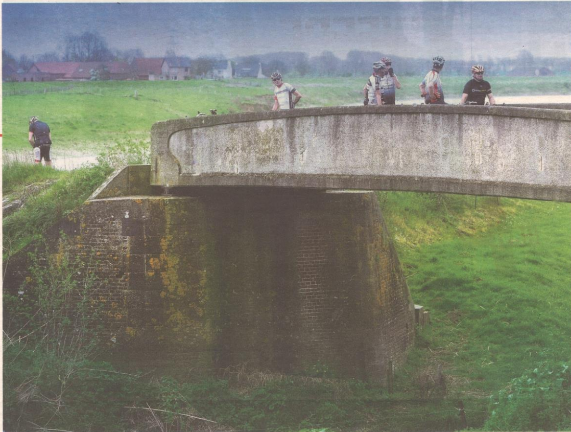
Het fietsroutenetwerk in Maaseik: even uitblazen aan de Labaerdijk.