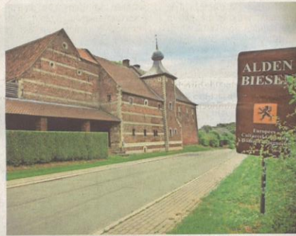
De rentmeesterswoning bij Alden Biesen zal gerestaureerd worden.

Naast deze projecten zal de Vlaamse regering ook investeren in een aantal andere projecten. «In Alden Biesen willen we nu een nieuwe attractie realiseren die de site toeristisch aantrekkelijker moet maken. De nabijgelegen rentmeesterswoning zal in dat kader ook gerestaureerd worden. Tot slot gaan we de mijnterriën in Beringen omtoveren tot een avonturenberg met trappartijen, wandelpaden en uitkijplateaus. Bovenaan zal een kunstwerk komen wat we 's avonds gaan verlichten, zodat het een 'landmark' voor de wijde omgeving wordt.»