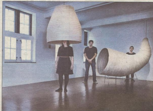
'It's all in the air' laat jonge talenten hun maatschappijkritische kunst tonen.